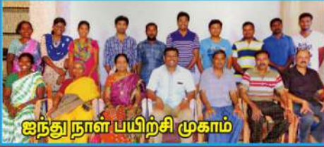
ஐந்துநாள் பயிற்சி முகாம்