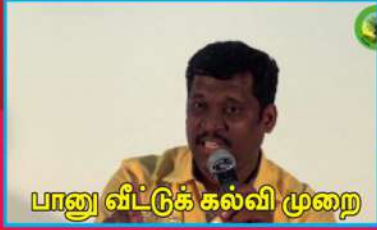
பானு வீட்டுக் கல்வி முறை