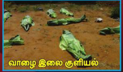
வாழை இலை குளியல்