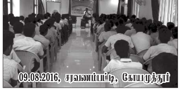
09.08.2016, சரவணம்பட்டி, கோயமுத்தூர்