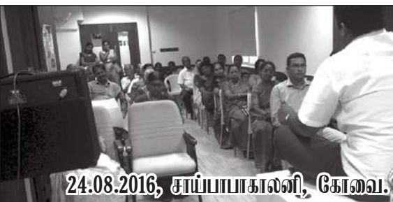
24.08.2016, சாய்ப்பாகாலனி, கோவை.