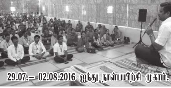
29.07.- 02.08.2016 ஐந்து நாள்பயிற்சி முகாம்.