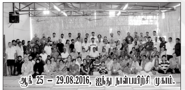
ஆக 25 - 29.08.2016, ஐந்து நாள்பயிற்சி முகாம்.