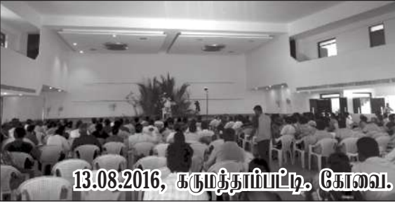
13.08.2016, சுமந்தரம்பட்டி, கோவை.