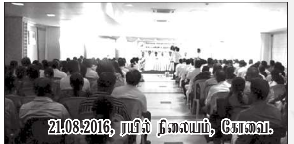
21.08.2016, ரயில் நிலையம், கோவை.