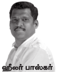
- ஹீலர் பாஸ்கர்

பயன்படுத்தலாம். மூளைக்கு இரத்த ஓட்டம் குறையும் பொழுது பூண்டை சாப்பிடுவதால் மூளை தன்னைத் தானே குணப்படுத்திக் கொள்கிறது.