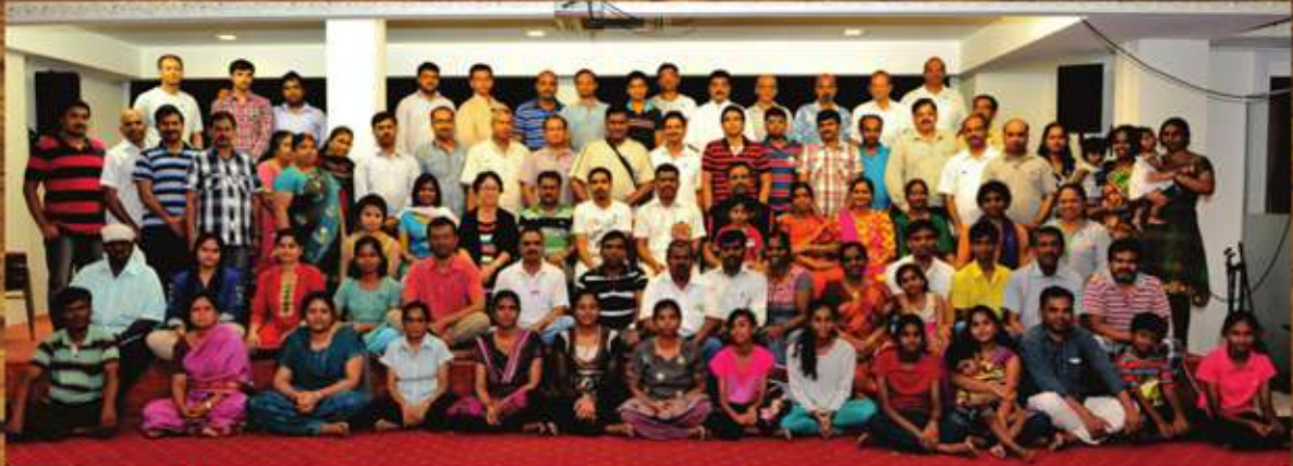
'சிங்கப்பூரில்' கடந்த ஜூன் மாதம் நடைபெற்ற அனாடமிக் பயிற்சி வகுப்பில் கலந்துகொண்டு பயனடைந்தவர்கள்.